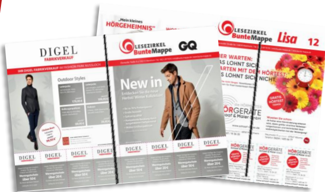
Umschlagseite mit Coupons